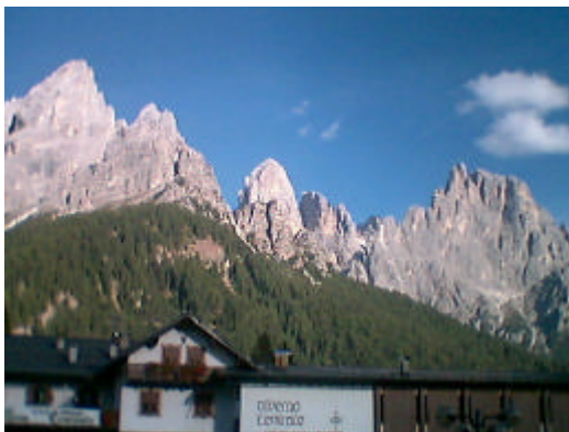
Dolomiten bei San Martino di Castrozza

aufgetankt - das Benzin ist ohne Quittung jedoch nicht billiger - machten wir uns über die Pässe Cibiana und Duran auf nach Agordo wo uns ein kleiner „teurer“ Imbiss erwartete. Schliesslich darf der Staat auch mal was an uns Turis verdienen. Passo di Cereda hiess die nächste Herausforderung. Herausforderung deshalb, weil man bei dem schönen Panorama sich zwingen muss auf die Strasse zu schauen. Schliesslich