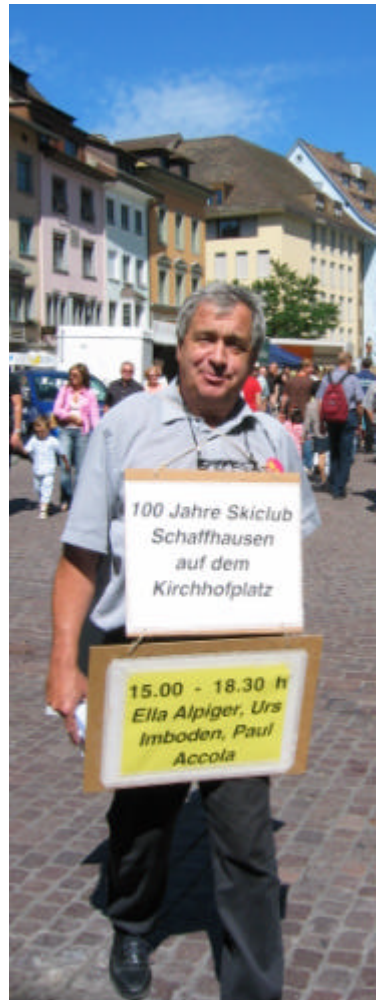
(OK-Präsident on tour)

WICHTIG: kommt alle an die GV, da gibt es noch mehr Bilder, noch mehr Impressionen, noch mehr Auskünfte!!