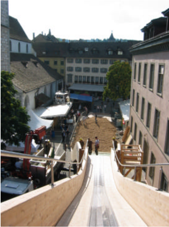
(Blick von der Schanze)

In diesem Sinne können wir alle stolz auf unsere Aktion sein!